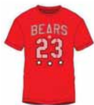
姓名和数字 具备锐利清晰的印花边缘 如同刻字膜转印工艺