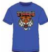
潘通色匹配和 实地色覆盖效果 如同丝网印花