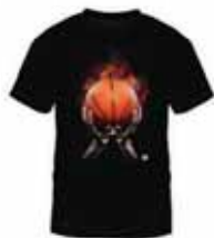
即使在深色面料上 也能呈现逼真且 半透明的印花图像