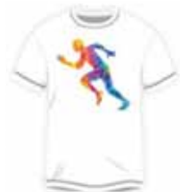
可在白色涤纶面料上 实现复杂的设计 如同热转移印花